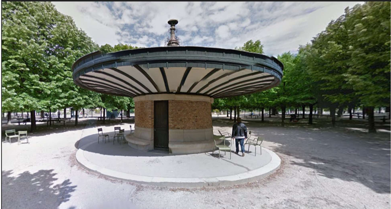
Jardin du Luxembourg, Paris