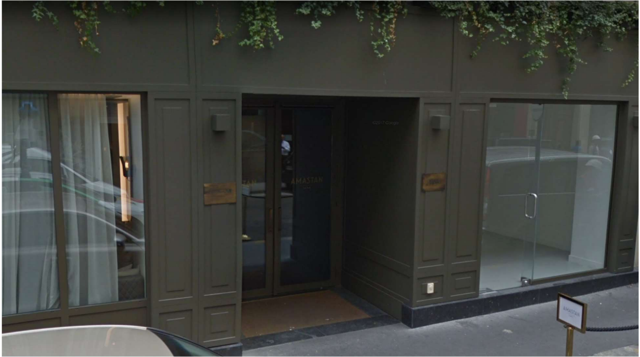
Rue Jean Mermoz, Paris